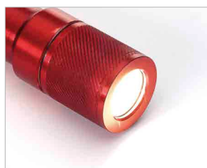
Power Led de última generación de elevadas prestaciones.